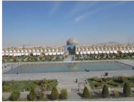
Imam-Platz in Isfahan mit Blick auf die Lotfullah-Moschee

Ein persönlicher Erfahrungsbericht mit Bildern und einzelnen Video-Clips einer Reise durch den Iran soll Einblicke in das Leben der Menschen dort und in die jahrhundertealte beeindruckende Kultur und Geschichte dieses Landes geben. Unter anderem lassen sich im Iran biblische Bezüge, christliche Einflüsse und Prägungen sowie Verbindungen zu Alexander dem Großen finden.